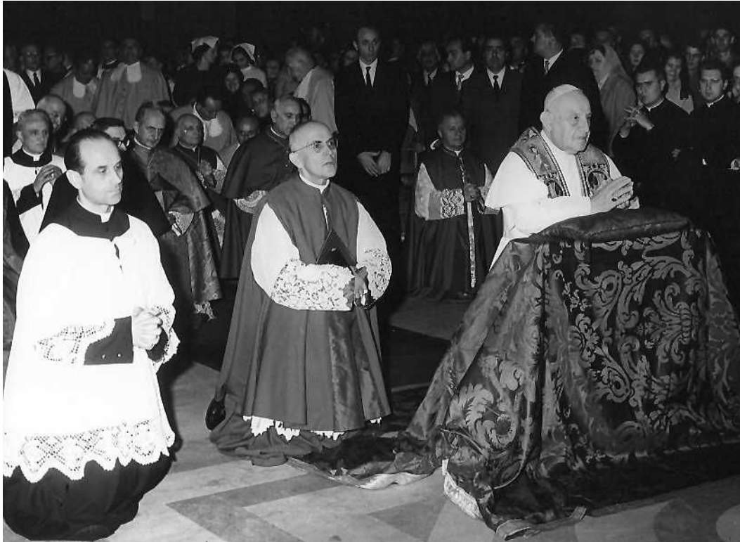
Sera dell'11 aprile 1962 Giovanni XXIII in visita alla Basilica di S. Carlo dove il 19 marzo 1925 era stato consacrato vescovo. Sulla destra si nota don Clemente Riva, dietro di lui l'allora Padre Generale Don Giovanni Gaddo e al suo fianco il cardinal Giovambattista Montini, arcivescovo di Milano

In questa casa visse Padre Balsari col suo Segretario fino alla morte (1935), in questa casa (precisamente al piano superiore occupato oggi dal Collegio Ecclesiastico S. Carlo Borromeo) si tenne la Congregazione Generale per la nomina del suo successore Padre Bozzetti (25.3.1935), in questa casa dimoreranno quasi tutti i Procuratori Generali dell'Istituto 14 , qui abiterà Mons. Clemente Riva Vescovo Ausiliare di Roma, qui oggi è la sede del Postulatore della Causa di Beatificazione di A. Rosmini, Padre Claudio Papa, che è anche l'attuale Rettore della Basilica.